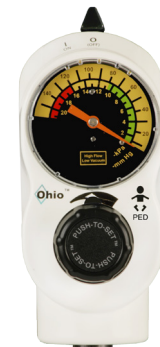
2-Mode PED 0-18 kPa (0-135 mmHg)

Verbesserte, im Dunkeln leuchtende Skala und Zeiger des Vakuummeters