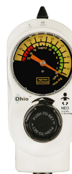
2-Mode NEO 0-13 kPa (0-100 mmHg)