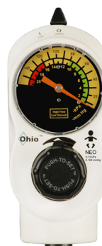
NEO 2 modalità 0-13 kPa (0-100 mmHg)