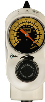
Vuoto elevato 3 modalità