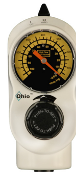
Vuoto elevato 2 modalità