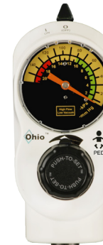
PED 2 modalità 0-18 kPa (0-135 mmHg)