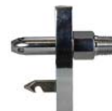
Salida de Consola compatible con Chemetron