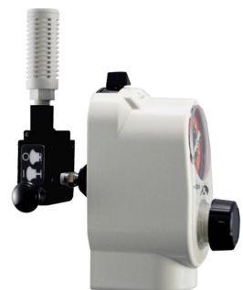
Venturi Backpack con Push-To-Set™ Regulador de vacío Intermitente