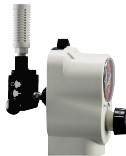
Venturi Backpack con Push-To-Set™ Regulador de vacío continuo