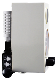
Venturi Backpack con Regulador de vacío Intermitente