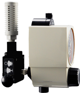
Venturi Backpack con Regulador de vacío continuo

Contamos con una variedad de combinaciones de Backpack Venturi y reguladores de vacío disponibles para satisfacer sus necesidades clínicas.