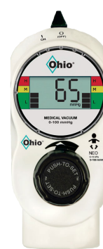
2-Mode NEO 0-13.3 kPa (0-100 mmHg)