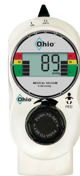
2-Mode PED 0-18.0 kPa (0-135 mmHg)

Variations indiquées par des codes couleur