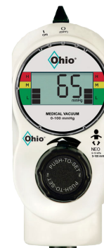
2-Mode NEO 0-13.3 kPa (0-100 mmHg)