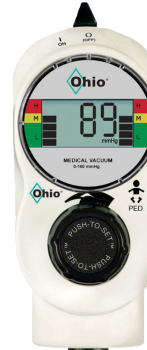
2-Mode PED 0-18.0 kPa (0-135 mmHg)