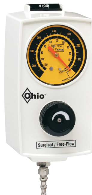
Alto flusso libero/uso chirurgico • Manometro 0-101.3 kPa • Manometro 0-760 mm di Hg

Il regolatore flusso libero/uso chirurgico può essere usato anche come strumento diagnostico per verificare la pressione massima delle prese a paret.