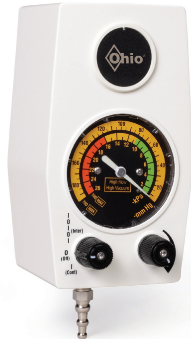
Intermittierende Absaugvorrichtung für Erwachsene