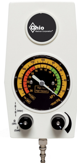
Intermitterend zuigtoestel voor volwassenen •0-200 mmHg •0-26 kPa