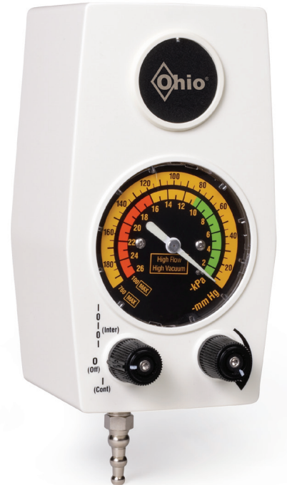
Unidad de succión intermitente para adultos