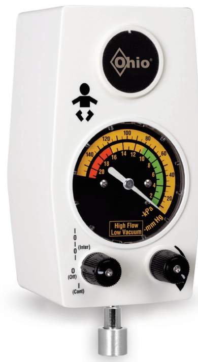
Pediatrische intermitterende afzuigenheid