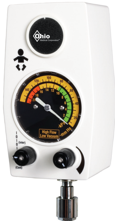
Unidad de aspiración intermitente para uso pediátrico