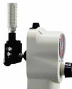
Venturi Backpack avec régulateur d'aspiration continu Push-To-Set™