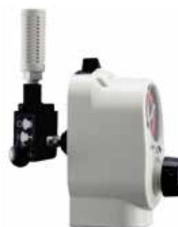
Venturi Backpack avec unité d'aspiration intermittente Push-To-Set™