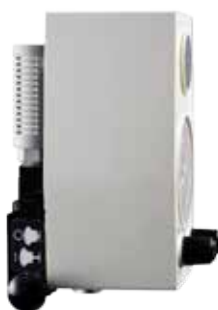
Venturi Backpack avec unité d'aspiration intermittente