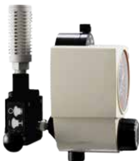
Venturi Backpack avec régulateur d'aspiration continu

Une variété de combinaisons de Venturi Backpack et régulateur d'aspiration est proposée pour répondre à vos besoins cliniques.