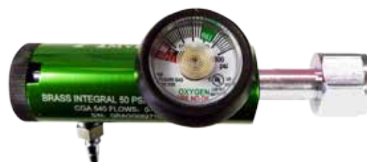
Régulateur à encliqueter à écrou et mamelon