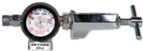
Régulateur compact à arcade