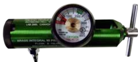
Régulateur à encliqueter à arcade