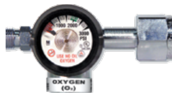
Régulateur compact à écrou et mamelon