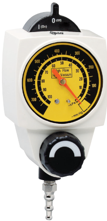
Hochvakuum-Modell mit 2 bzw.3 Modi • 0-101.3 kPa-Anzeige • 0-760 mmHg-Anzeige