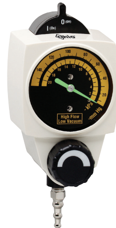
Kontinuierliches Niedrigvakuum-Modell mit 2 Modi • 0-21.3 kPa-Anzeige • 0-160 mmHg-Anzeige